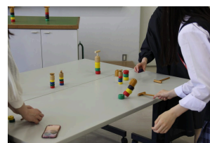
保育科：遊び体験「昔の遊 び」