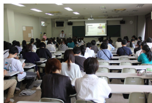
初回参加者向けの全体会