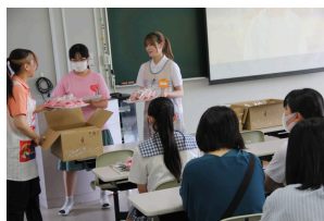
学生スタッフによるお土産の配布