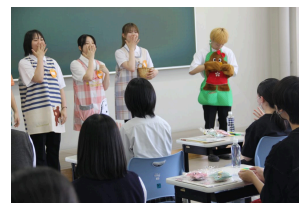
保育科：エブロンシアター 「くいしんぼうゴリラ」