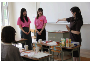
キャリア科：体験授業「防災 ハンドメイド」