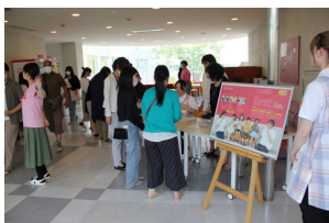
初回参加者用の受付