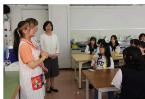
保育科：先輩と話そう「先輩 と話し」