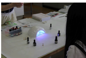
キャリア科：体験授業 「ファッションの世界」