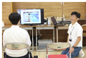
キャリア科：体験授業「最新 コーチング！」