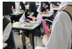
保育科：体験授業「くるくる ヘリコプター」